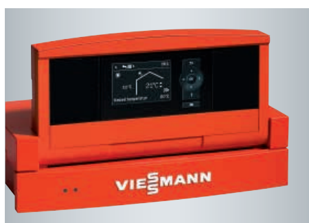
Régulation Vitotronic 200 d'utilisation intuitive